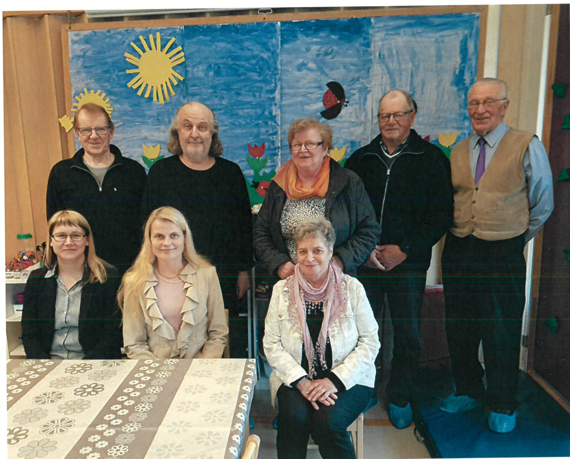
Tarkastuslautakunta ja tilintarkastaja kuvattuina Päiväkoti Kiepissä 9.5.2017