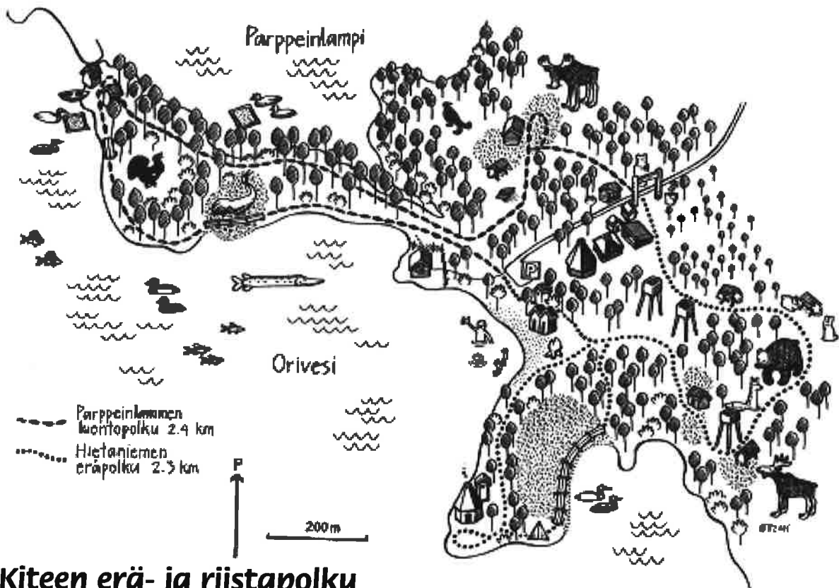
Kiteen erä- ja riistapolku