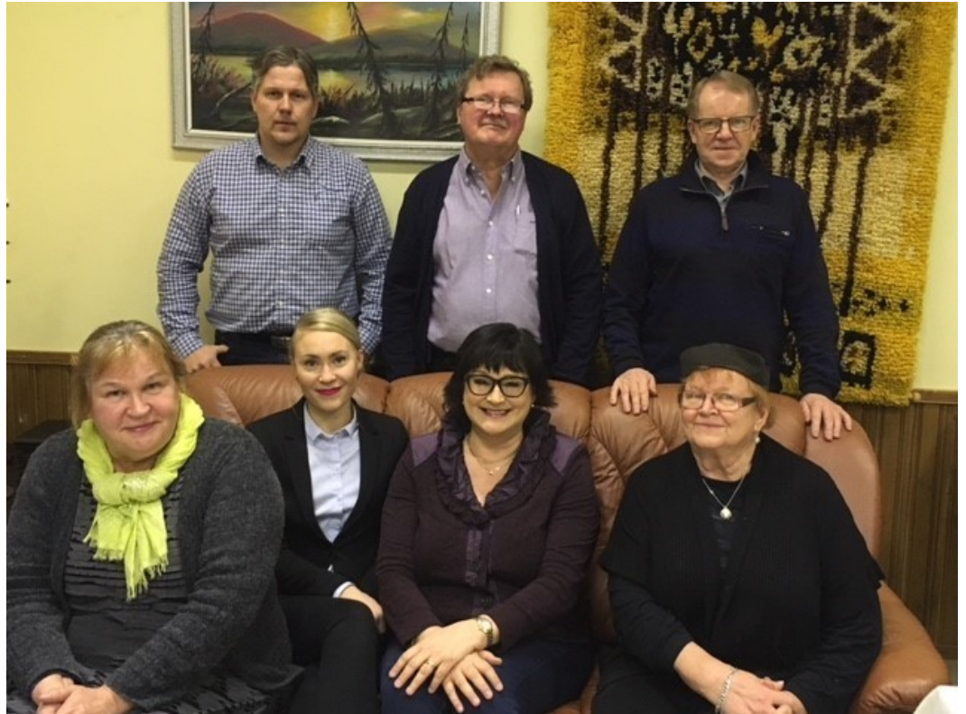
Tarkastuslautakunta kokouksessaan 8.12.2017