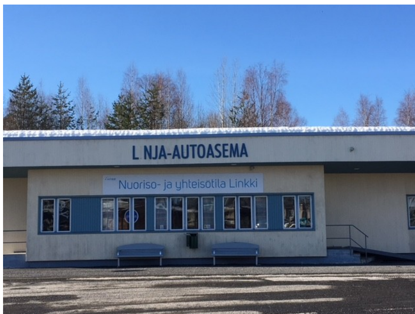
Entiseen linja-autoasemaan remontoitiin Nuoriso- ja yhteisötila Linkki.

AIMO:n tiehanketoteutus painottui vuoden 2017 loppuun ja haastavista olosuhteista (kantamaton suopohja) johtuen rakennustöitä ei saatu loppuun vuonna 2017.